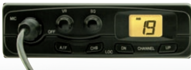
APPARATO CONFORME R&TTE 95/05/CE

Ares Nero - Ref. 05770405 Ares Silver - Ref. 05770406