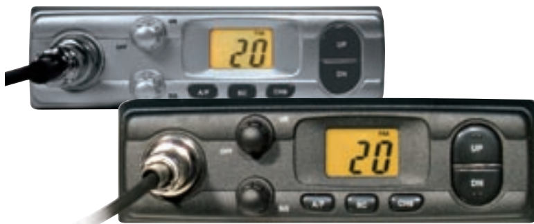
APPARATO CONFORME R&TTE 95/05/CE