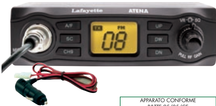
APPARATO CONFORME R&TTE 95/05/CE